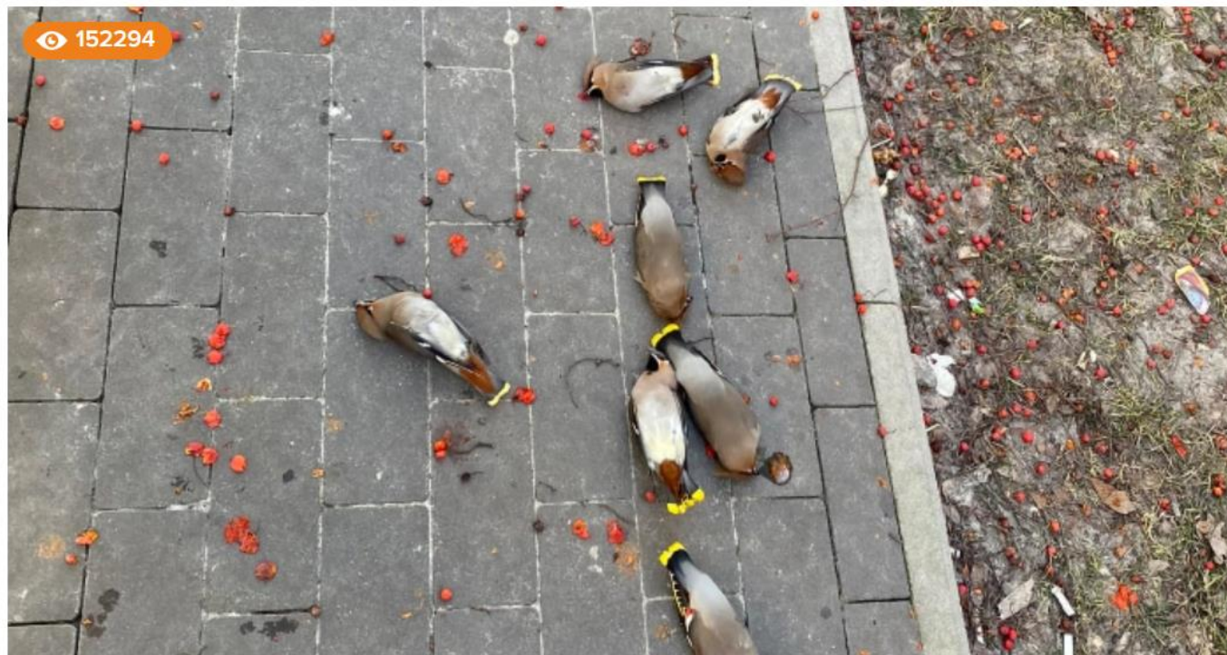
Сп'янілі від ягід птахи засинають посеред вулиць взимку: як їм допомогти

Пташки омелюхи спяніли від поїдання ягід та попадали на асфальт. 🙀